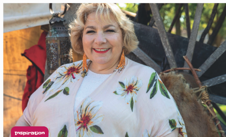
Capture d'écran tirée du site des As de l'Info